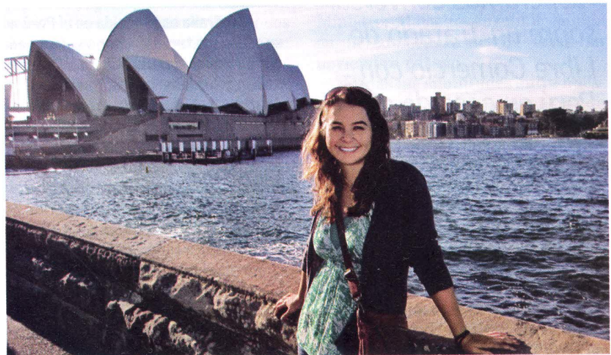
Australia es el tercer destino preferido en todo el mundo por los estudiantes internacionales.